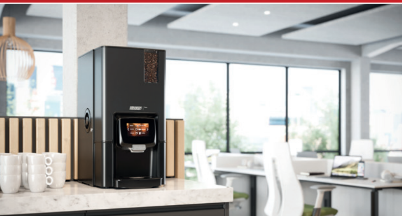
Ihr Bravilor Bonamat Fachhändler

Für weitere Informationen wenden Sie sich bitte direkt an Bravilor Bonamat.