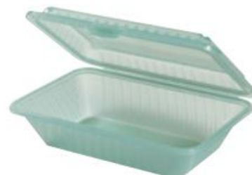
G10.003.0021 grün (green) VPE / PU 12