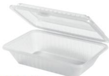
23 x 16,5 x 6,4 cm G10.003.0020 weiß (white) VPE / PU 12