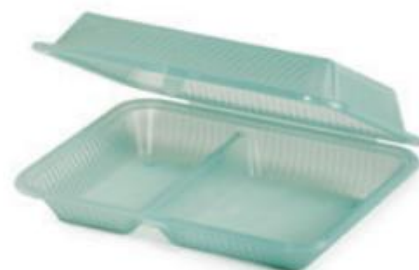
G10.003.0027 grün (green) VPE / PU 12