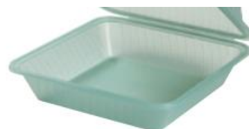
G10.003.0019 grün (green) VPE / PU 12