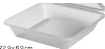
22,9x22,9x8,9 cm G10.003.0018 weiß (white) VPE / PU 12