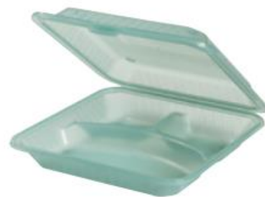
G10.003.0023 grün (green) VPE / PU 12