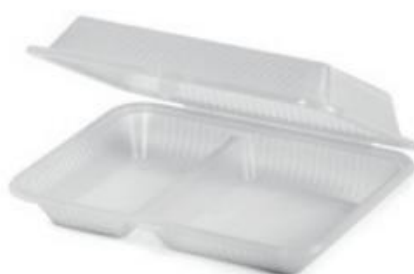
20,3x25,4x7,6 cm G10.003.0026 weiß (white) VPE / PU 12