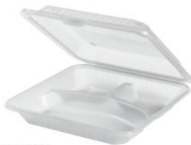
23x23x7 cm G10.003.0022 weiß (white) VPE / PU 12